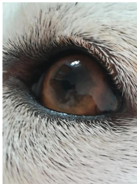
Svetla S. Ornik (10 let), Okroglo, barvna fotografija, 2020