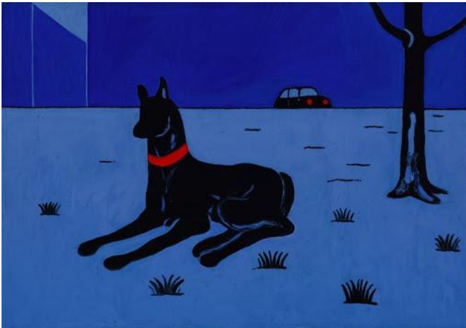
Zmago Jeraj, Pes, 1967, olje na platnu, 70 x 100 cm, Zbirka UGM.