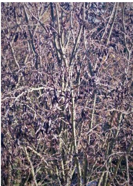
Svetla S. Ornik (10 let), Črte, barvna fotografija, 2020