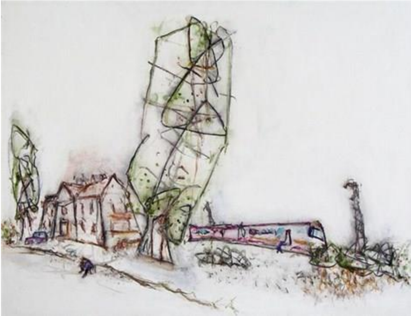
Zmago Jeraj, Brez naslova, 1998, olje na platnu, 100 x 130 cm, Zbirka UGM

Zmago Jeraj (1937 – 2015) je svojo razgibano kompozicijo pik, črt in oblik dopolnil z barvo. Risbo (črte, linije) in slikarstvo (barve) je pogosto združeval v eni umetnini.