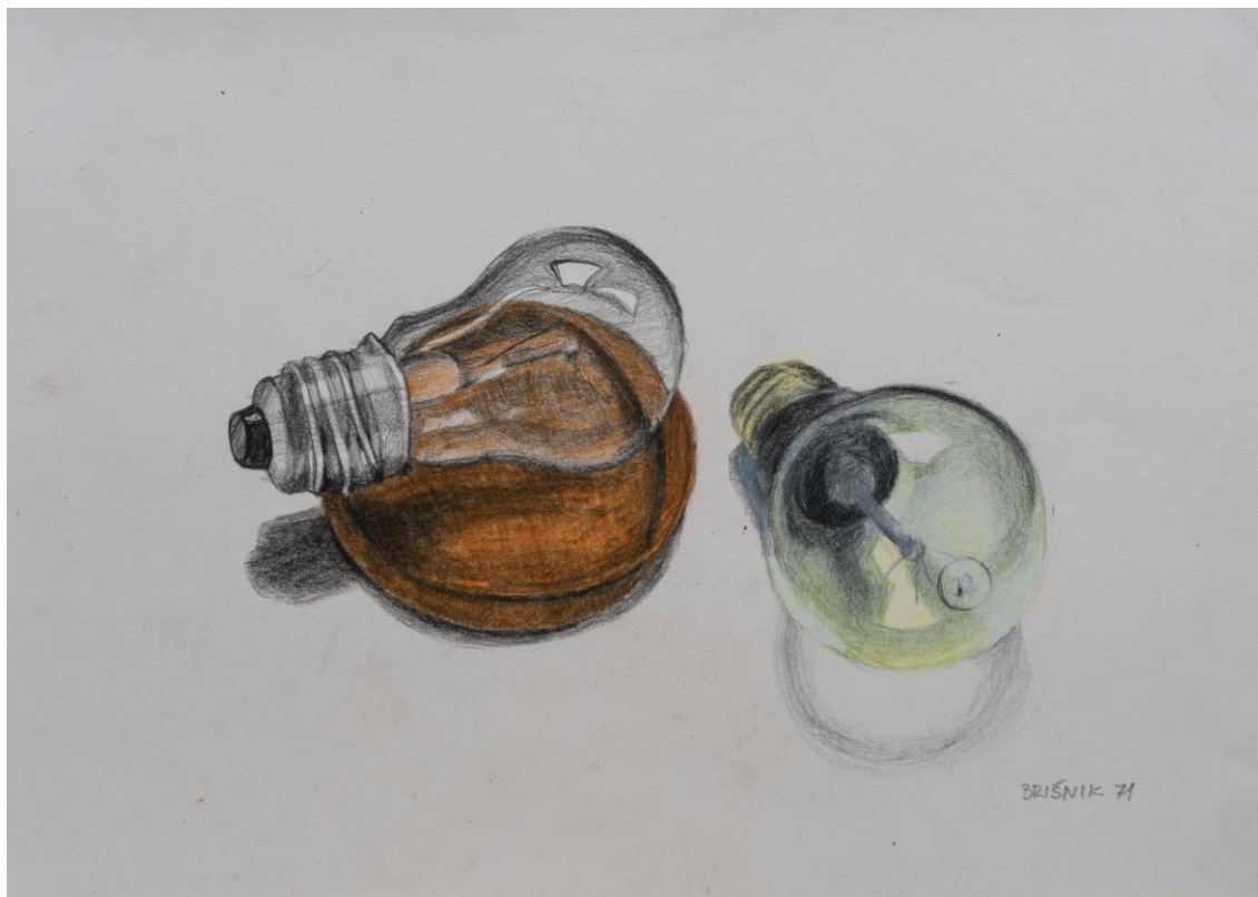
Ida Brišnik Remec, Žarnici, 1971, risba z barv. svinčniki, inv. 1657