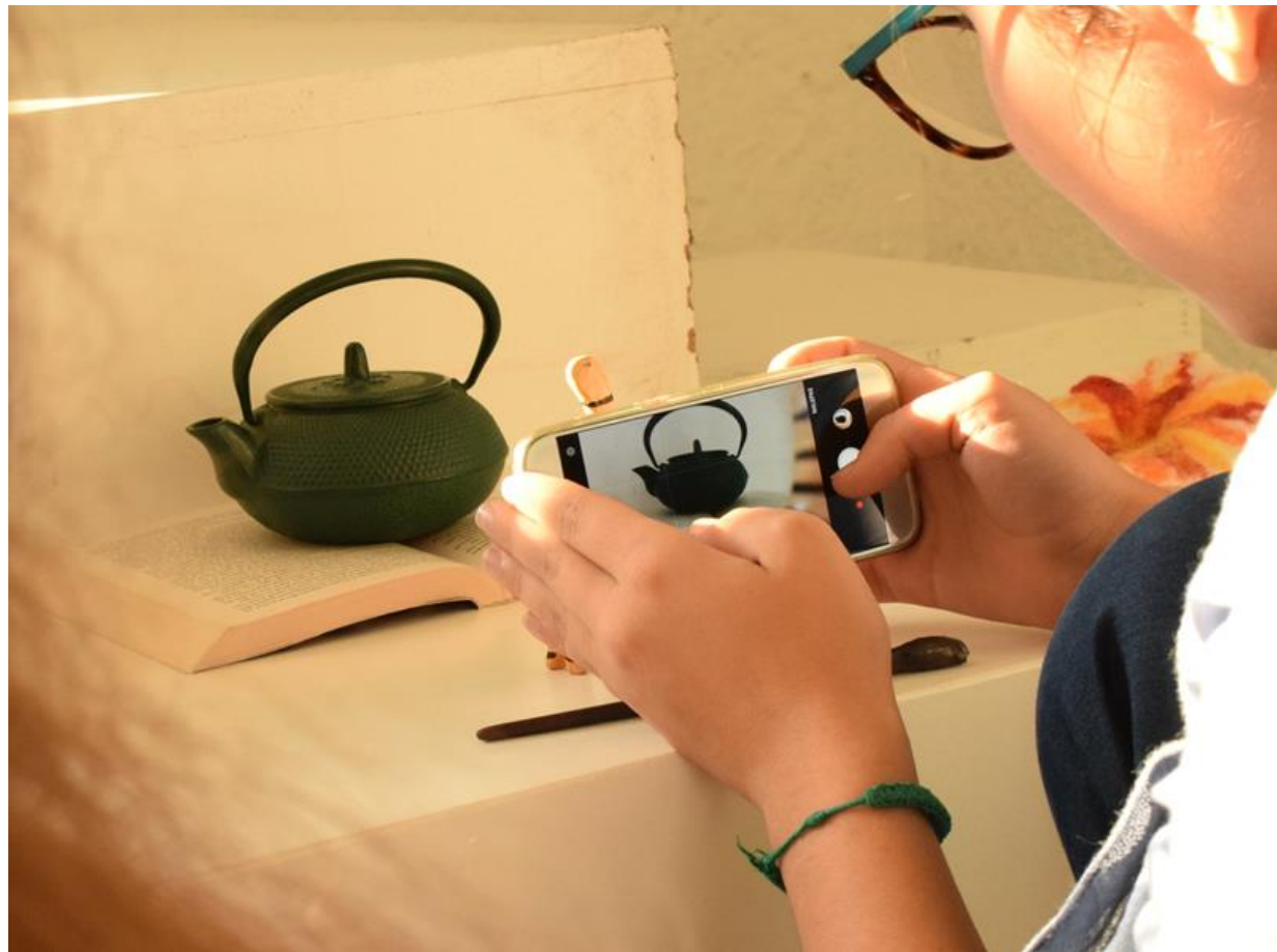
Otroške ustvarjalnice v UGM

TIHOŽITEJE LAHKO NARIŠEŠ, NASLIKAŠ, FOTOGRAFIRAŠ ALI CELO POSNAMEŠ. SVOJE IZDELKE NAM POŠLJI NA NASLOV: INFO@UGM.SI