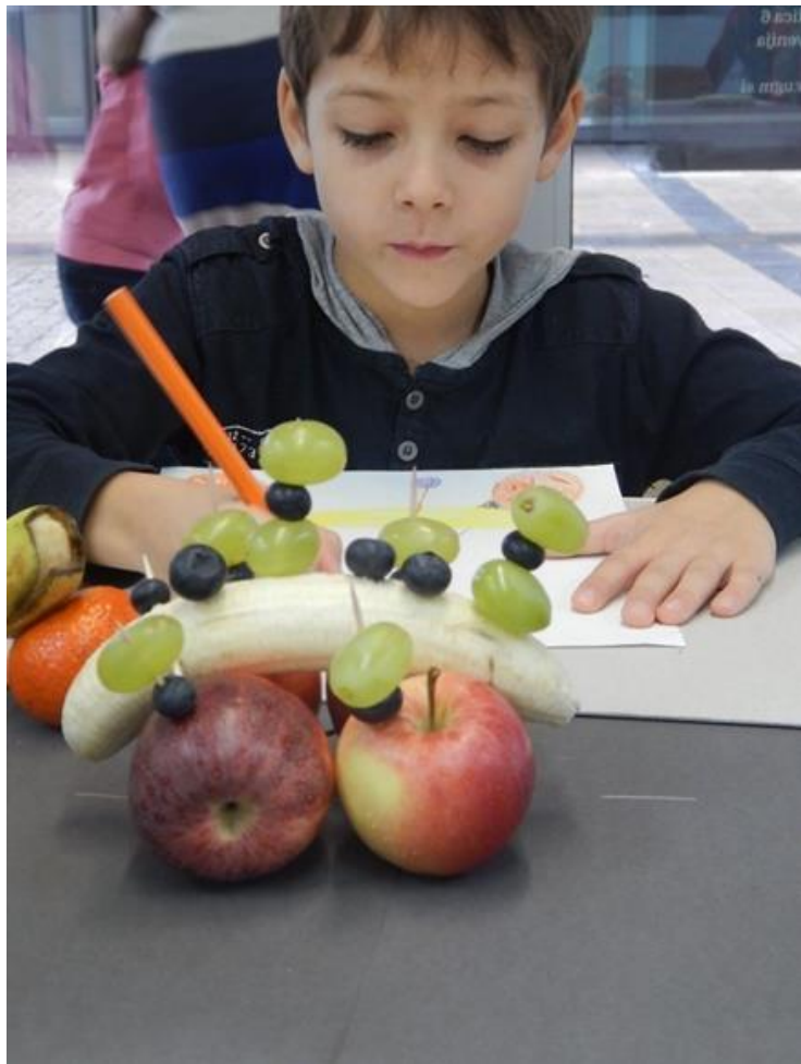
Otroške ustvarjalnice v UGM

PRIPRAVI POSTAVITEV ENEGA ALI VEČ PREDMETOV. MORDA IZBEREŠ KAKŠEN SVOJ NAJLJUBŠI PREDMET ALI SADJE, KI TI JI BARVNO ZANIMIVO. RAZMISLI, KAKŠNO BI BILO OZADJE OZIROMA PROSTOR, V KATEREGA BOŠ NAMESTIL SVOJE TIHOŽITJE.