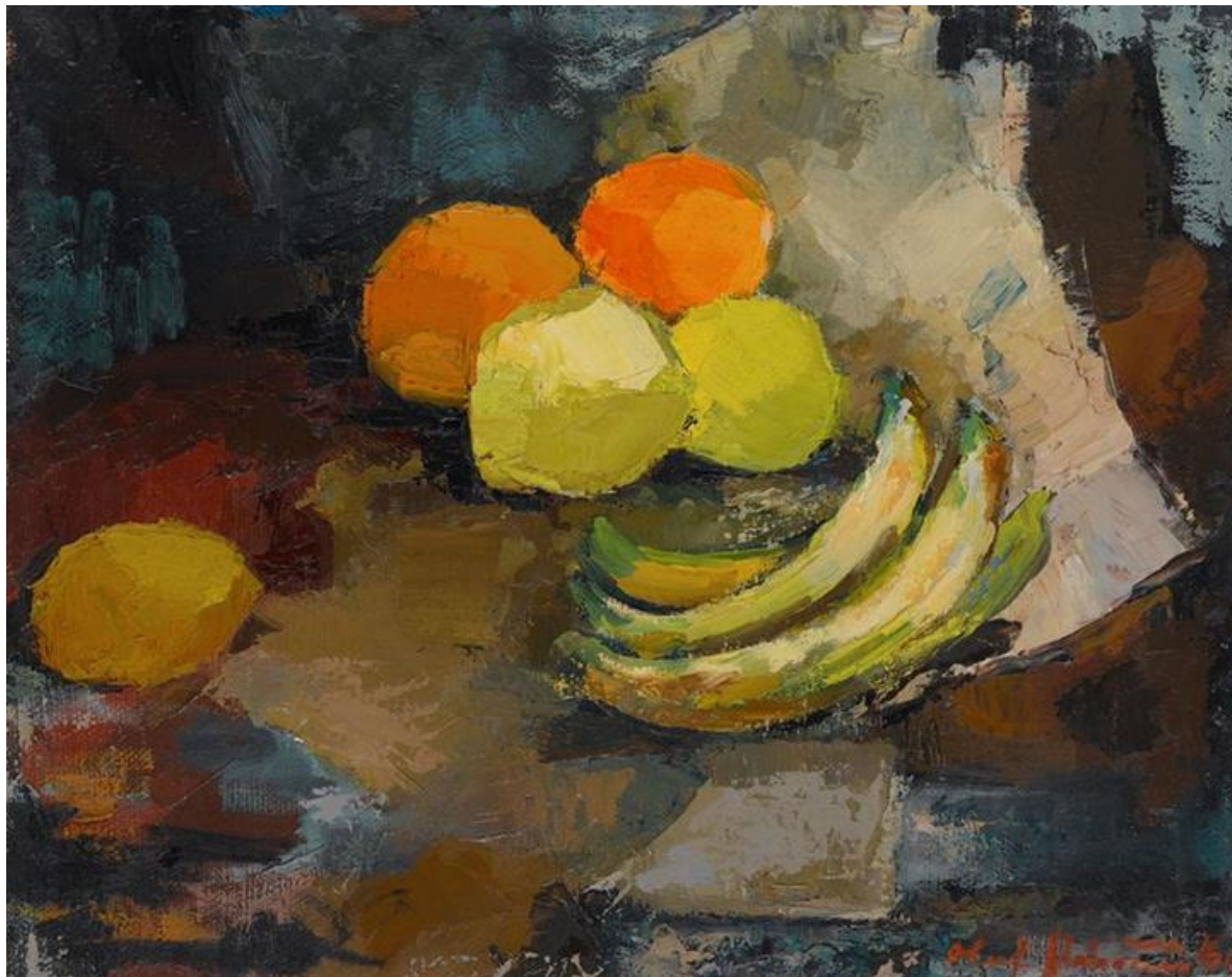
Olaf Globočnik, Banane, 1960, olje na platnu, 42 x 33 cm

BANANA JE TIHO. TUDI LIMONA SE NE OGLAŠA, PRAV TAKO POMARANČA. JA, TO JE TIHOŽITJE.