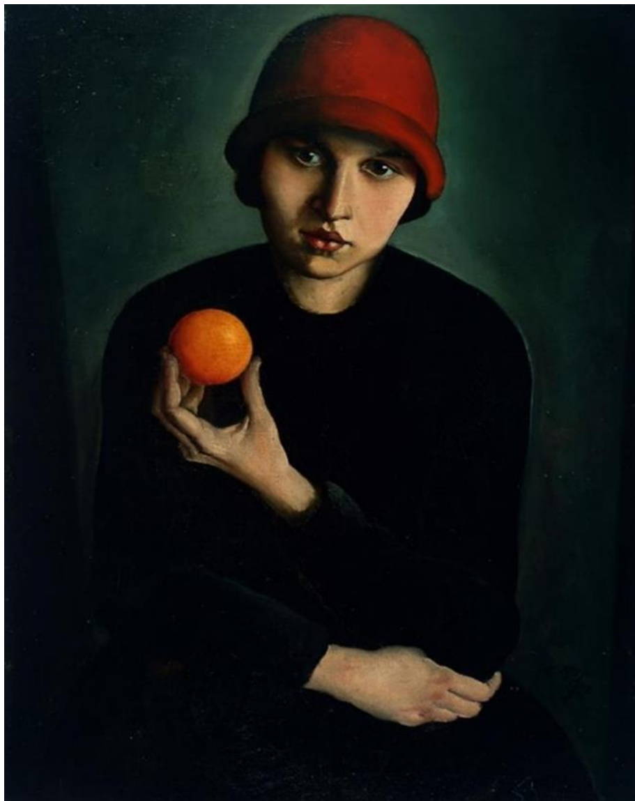
Ivan Kos, Deklica z oranžo, 1927, olje na platnu

TIHOŽITNI PREDMET JE LAHKO TUDI DEL DRUGEGA MOTIVA – NA PRIMER PORTRETA.